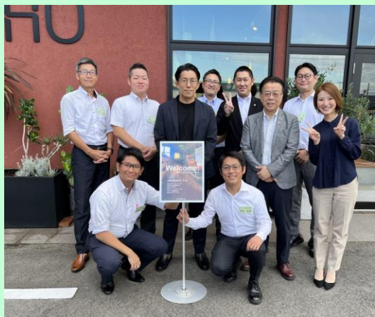
代理店ベンチマーク研修