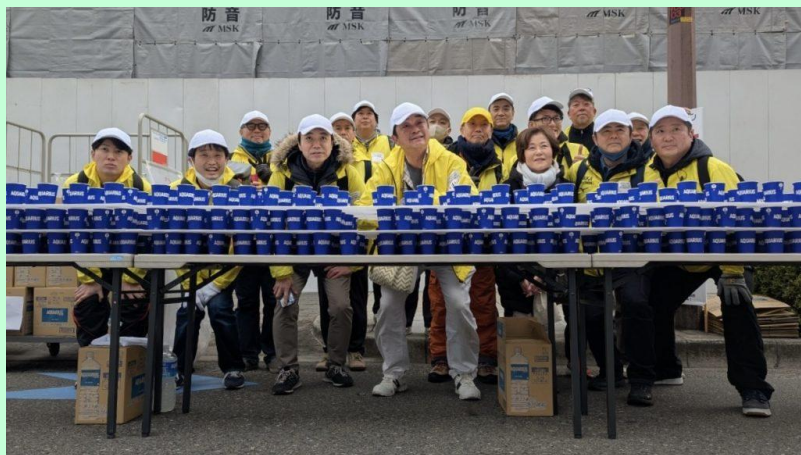
大阪マラソンボランティア