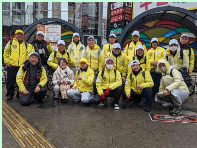
大阪マラソンボランティア