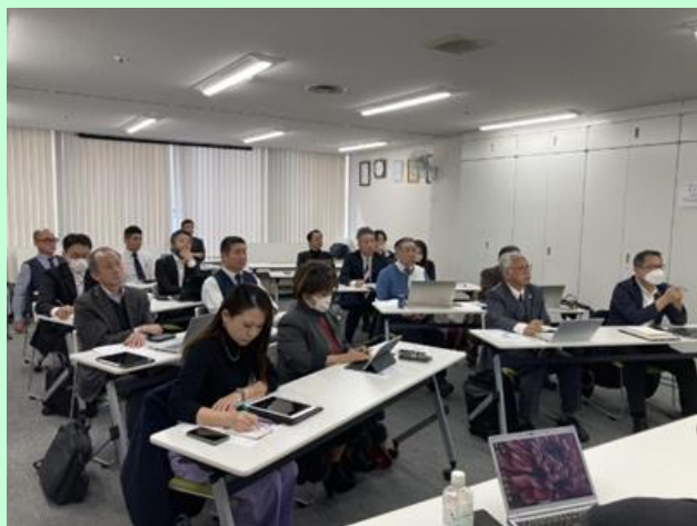
ジギョケイ認定取得ワークショップ