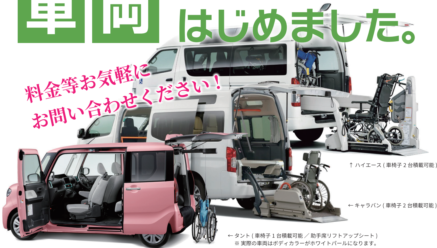
↑ハイエース (車椅子2台積載可能)