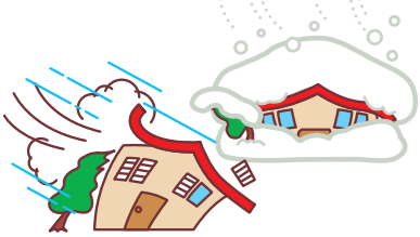
台風や大雪による被害