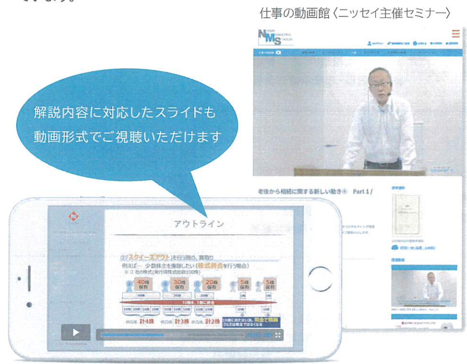
〈スマホでの視聴イメージ〉

▶ニッセイ主催セミナー 生命保険販売・マーケット開拓に資する最新情報をお届けすることを目的に、動画及び解説教材をご提供します。